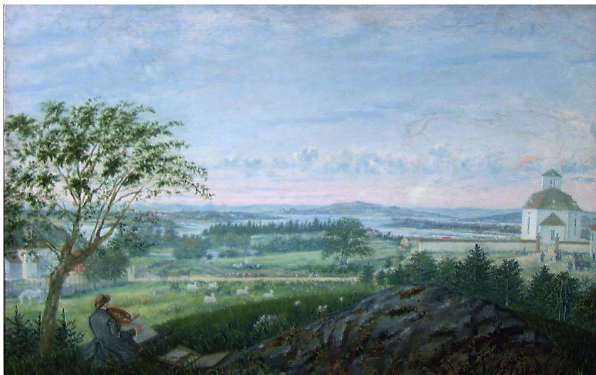
Utsikt mot Vang kirke, Matthias Stoltenberg 1863.