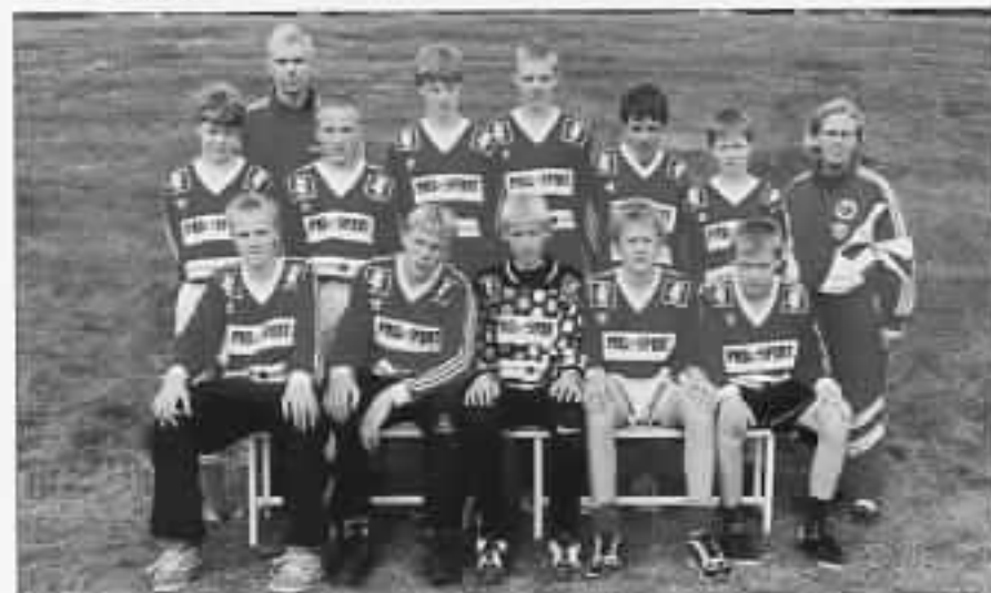
Småguttlaget fra 1998 på tur til Grus og Grus-turneringen. Turneringsdeltakelse er en viktig sosial begivenhet både for spillere og foreldre.