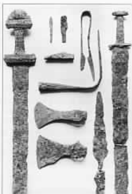
Våpengrav fra husmannsplassen Fagerli under Vang Prestegård.

økonomiske ressurser enn bøndene på de mer marginalt liggende gårder, noe som ikke er særlig overraskende, når en tar det forskjellige landbruksgrunnlag i betraktning.