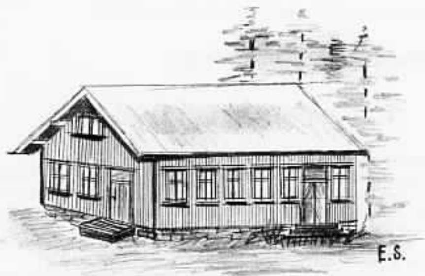
Skisse av Sole anno 1909.