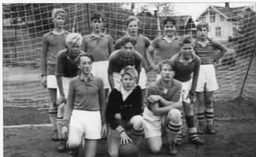
Småguttlaget som ble kvartsmestre i 1951. Utstyret er nok så forskjellig fra 1998-utgaven. Bemerk spesielt mangelen på draktreklame. I 1951 hadde kommersialismen dårligere vilkår enn i våre dager.