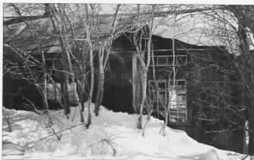
Verkstedet i Løvlien Nedre (Skifabrikken).