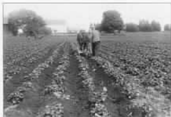
Potetrensning med ard. Hagåkeren på Møystad, 5. 7. 1916.