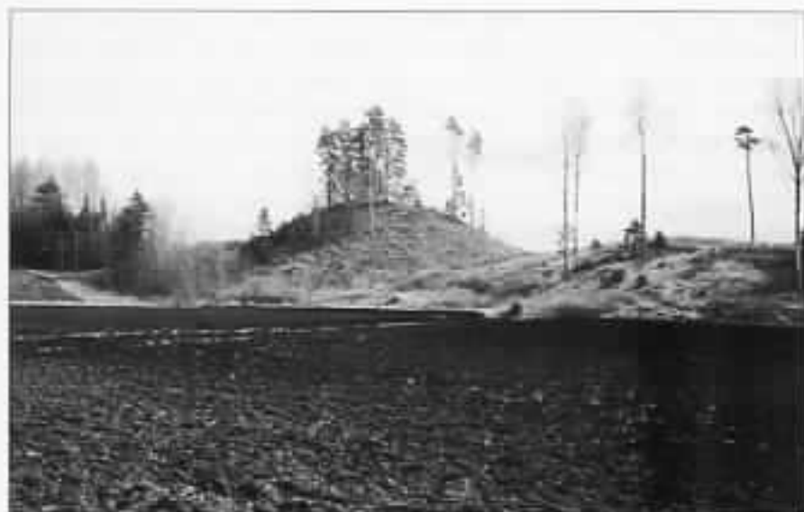
Heidsavisting med Halvdanshaugen i bakgrunn med tenkt tingplass i forgrunn. Bildet er tatt fra Kayhaugen.