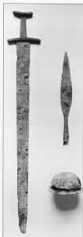
Våpengrav fra Dalseng.