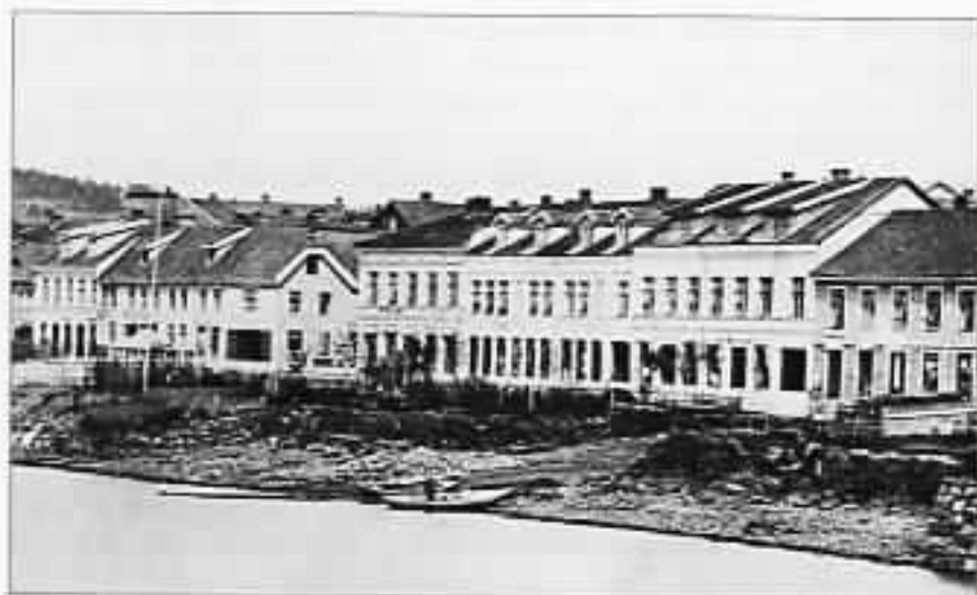
Variasjonen i vannstanden og det at byen ble stykket ut så nær Myna, var et stadig tilbakevendende problem. Særlig var det stort den første tiden. Bildet er tatt mot Strandgt. omkring 1870.