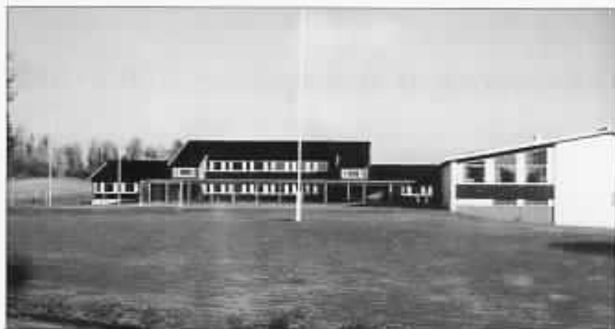
Lunden skole i 1982.

Slemsrud nordre, Greften, Kjos, østre Dystvold, Bergsvensrud, Spikrud, nordre Kirkebye, Aalerud.