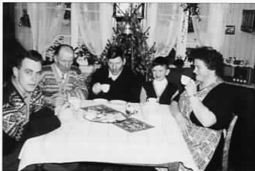
Æftaskaffe rundt stuebordet på Ner-Tonster. Jultre står i milla glasom slik det plo gjöra.

mea'n far sætt på lysa. «Vi skulle fell ha prøvd om det lyse før vi sætte dom på», see'n far å bøye seg fer å sætta ti kontakta. Så bir det stille bortve veggan der'n dreg kontakta ut og inn uten att nåe sljer.