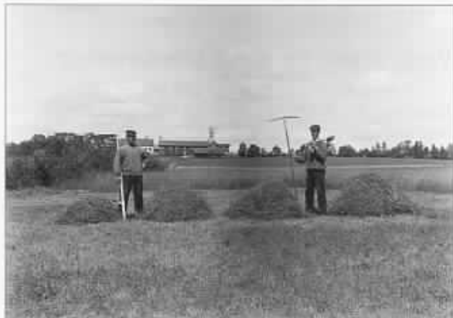
Høsting av engfôlt på Hjøllum 12.7. 1906.