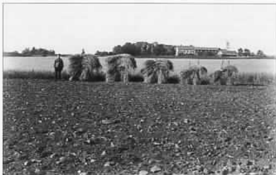
Fra siltidoforsøk med rug på snesestaur på Hjellum 9.8. 1911.