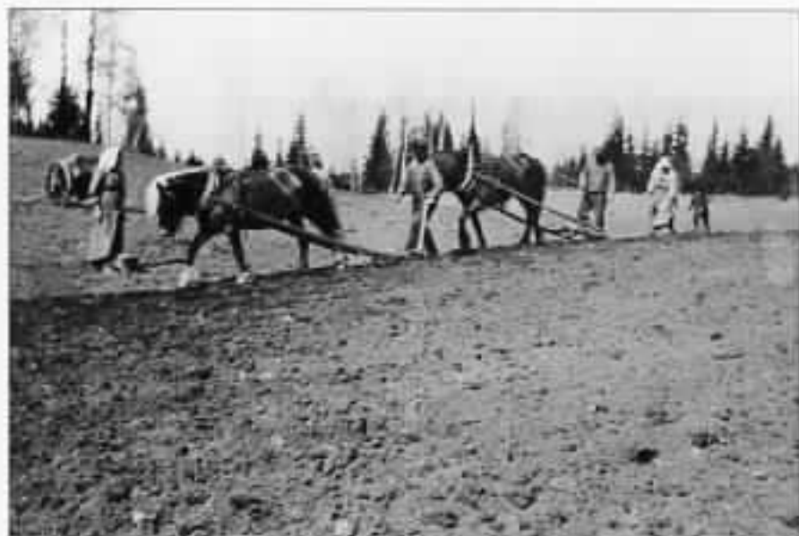
Potetsetting med ard på Alstad.

som i Tverstilling mod Furen udvidet og fordybet denne og gav den ønskelige Plads for Frøpotetene. Tre eller fire «Sættere» fulgte umiddelbart efter Ardkjøeren og satte Poteterne i Furen fra hver sit Trækjøreld, Botte eller Kolle, et stykke hver, skiftende om hverandre fremover til Furens Ende. Like efter Sætterne kom «Møkkusken» med Hest og fyldt Gjødelskjærre kjørende langs Furen hvori to voksne Karer, sommetider ogsaa Kvinder, med hver sin Træroko, senere hen Spade, spredte eller drysset Gjødelsel ovenpaa det nedlagte Frø. Denne i Regelen ublandede Ku- og Hestegjødelsel var om Vaaren tilkjørt Aakeren i Hauger (Dynger) og blev før Sættingen omgravet og smuldret for at kunne jevnfordeles i Sættefuren. Til Gjødelspredningen valgtes gjerne de hændigste og raskeste Arbeidere, da det væsentlig berodde paa disse, om Sættingen kunde gaa raskt fra Haanden og Gjødelsfordelingen udføres omhyggelig og nølagtig. To Mand var pladsert ved Gjødelsdyngen og de havde til Opgave aa oplæsse og tilkjøre Gjødelsen i betids, saaledes at Sættearbeidet kunde foregaa uden Stands. Indtraadte der isaahenseende