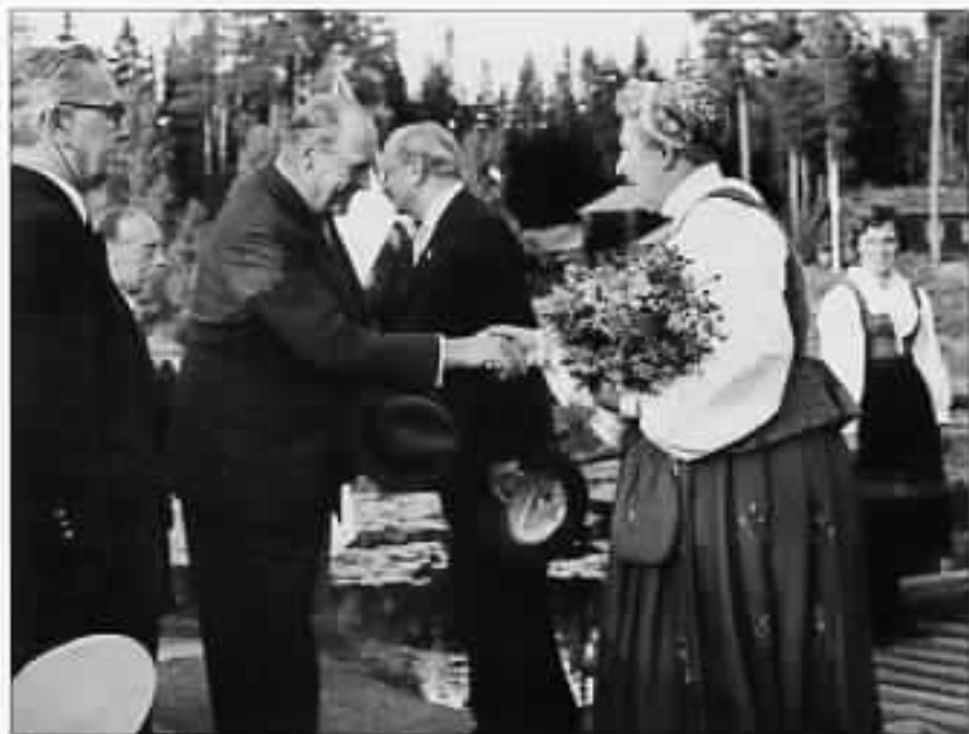
Velkommen til Maihaugen, Deres Majestet!

Hun så det som en hovedoppgave at kvinnene skulle skolere seg – at de skulle få innsikt, kunnskap og mot til å delta i samfunnsstyringa. Studieringer ble et viktig redskap i dette arbeidet. En skal huske på at så sent som i 1950-åra var kvinnene stort sett hjemmeværende og sett på som ubrukelige i styre og stell. Nå ble det satt i gang studieringer av alle slag, - praktiske og teoretiske. Det første regnskapskurset for kvinner ble holdt i 1958. Det falt ikke i god jord hos alle. «Å skulle nå kvinnfolka mæ slikt!»