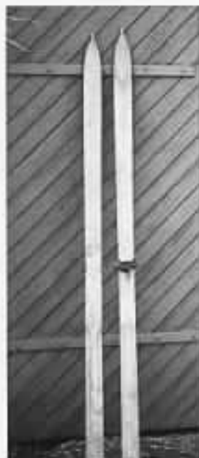
Ločički i hvošč.

Tynsetkara var allsidige karer med gode evner som de utnyttet godt. Minnet om dem vil leve lenge i Vangsåsen.