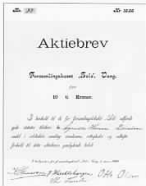
Aktiebrev fra 1898.

I denne forbindelse må nevnes om hvordan drakampen mellom Arbeiderdemokratene og sosialistene kunne arte seg. Foreningen hadde meldt seg inn i D.N.A. Men på generalforsamlingen i 1905 i Vang Arbeiderforening hadde det meldt seg inn så mange borgelige og få av arbeiderpartiets folk at Venstre satte inn et flertall av sine folk i styret. Slik