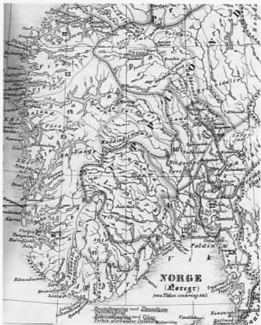
Kart over Eidsivaldings lag med Viken omkring 1015.