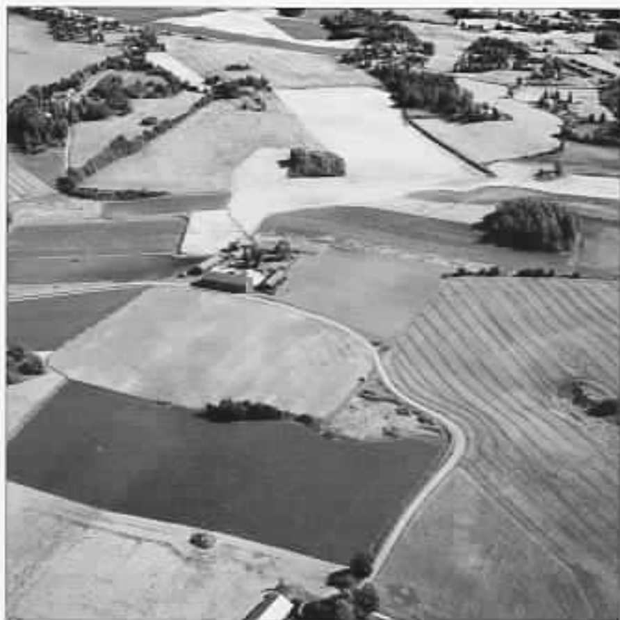
Figfoto over utgravingen på Valum.

interesse, og kanskje også vekket en lyst til å sette seg enda mer inn i bygdas eldste historie. På Hedmarksmuseet finnes en oversikt over oldfunn og gravhauger i Vang, som jeg har utarbeidet. Her kan en hente mer detaljert informasjon om bygdas rike oldtid. I Åkerutstillingen på Hedmarksmuseet kan en se en rekke oldfunn fra Vang, så et besøk dit anbefales også.