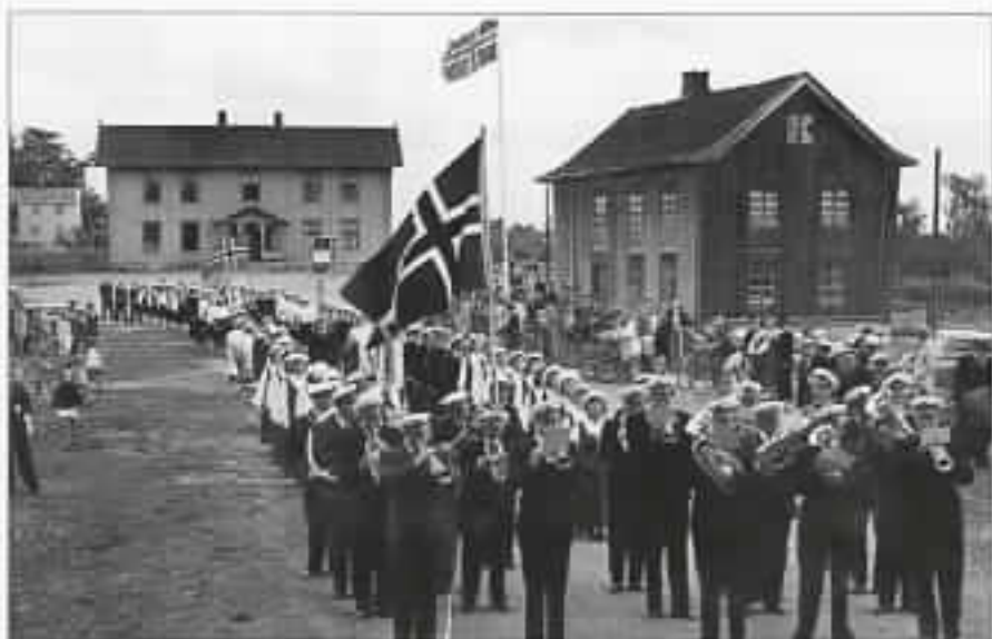
Kirkekretnen skole og det gamle kommunelokalet ført på 50-tallet.

kom med hesteskyss og hadde behov for å bli kvitt hesten sin mens de utførte sine ærend på kirkegården eller i det gamle kommunelokalet som lå nederst på leikeplassen. Derfor var det langs den langsida av leikeplassen som vendte mot Vangsvegen, satt opp hestebindinger. Det var solide lange trestokker som var lagt oppå og forsvarlig festet til loddrette trepåler. Til de vannrette trestokkene var festet jernringer, og til disse ringene ble hestene bundet. Vinterstid fikk hestene stå i stallene. I forlengelsen av uthusene som tilhørte Klokkegården, lå 8 – 10 staller. Der nede var også utedoene, og av dem var det fem stykker. Der var det mye interessant lektyre på veggene. Førstelæreren på skolen var også klokker, og han og hans familie holdt til i Klokkegården. Til den hørte et fjøs med plass til to kuer og hus for både gris og saug og høns.