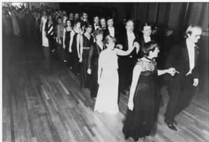
Salen er ryddet. Polonaisen åpner ballen.