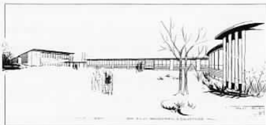
Skulebygningene på Ener vakte oppsikt langt utenfor Vang. Kurt J. Scheffler var arkitekt for bygget.

Den eneste skolen i Vang med byskoleordning i noen år var Solvang.