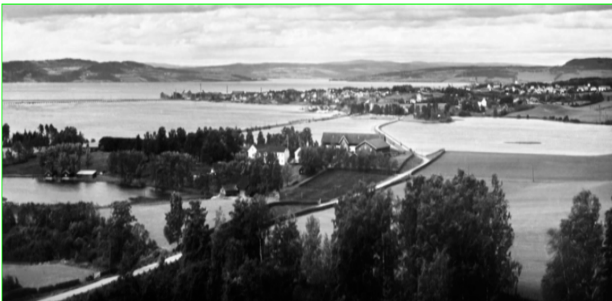
Åker gård 1929

"Betre byrði du ber'kje i bakken enn mannavit mykje" (Håvamål)