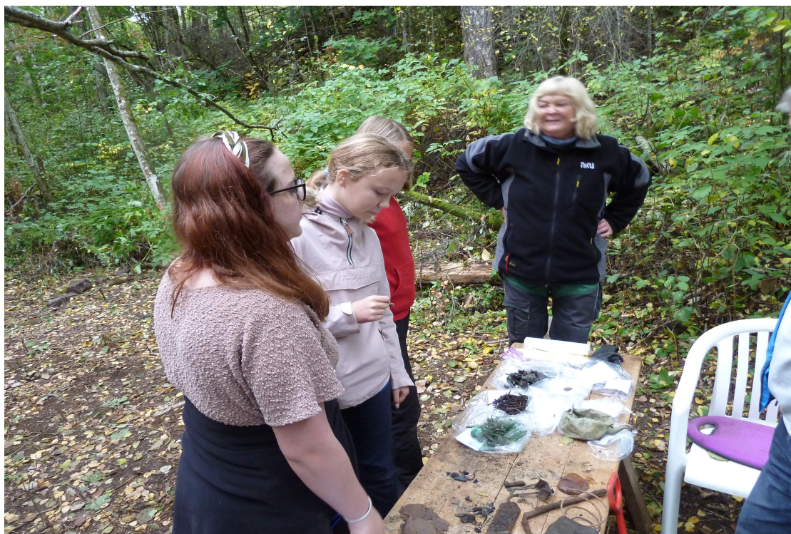
Fra skoleprosjekt i Dysvollberget