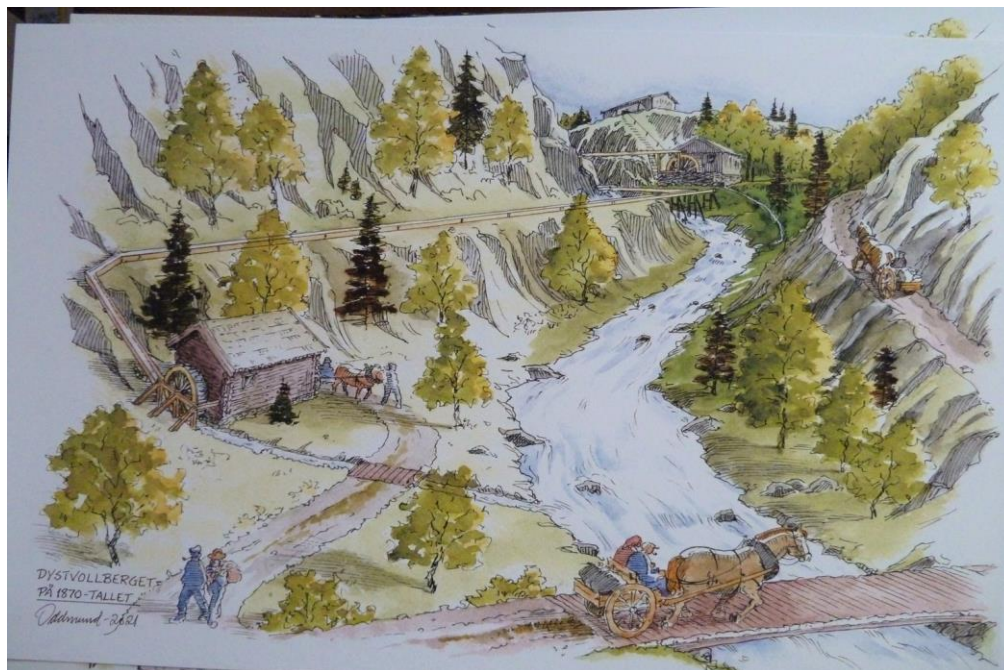
Dystvollberget 1870 tegnet av Oddmund Mikkelsen