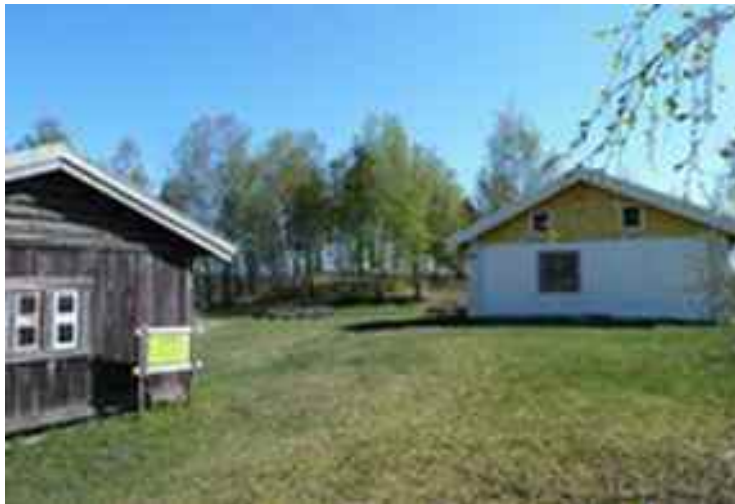
Elvsholmen, nyoppusset og fin