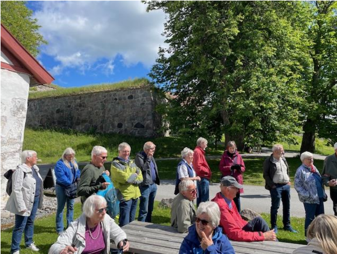
Glimt fra turen til Kongsvinger Festning.