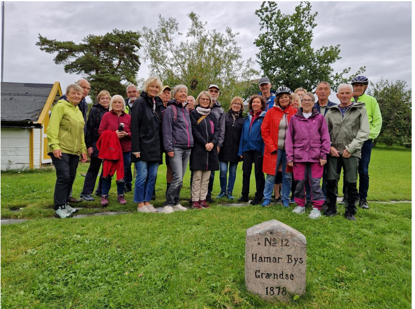
Fornøyde vandrere ved grensesten nr. 12 mellom Hamar og Vang.